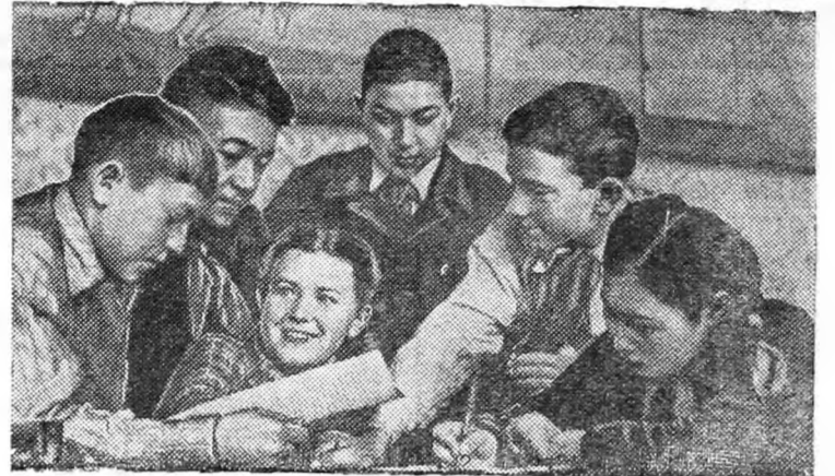
Пионеры города Алма-Ата ведут дружескую переписку с ребятами столицы Югославии — Белграда.

Выше знамя предмайского социалистического соревнования! За новые трудовые успехи во славу нашей Родины, товарищи!