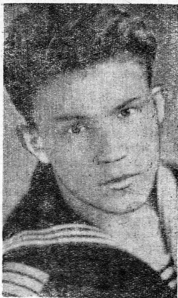
бы он не выполнил задания или в чем-то ослушался. И душа у него чуткая, отзыв-