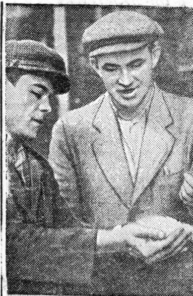
БАШКИРСКАЯ АССР. Новую продукцию — полиэтилен — начали изготавливать на крупнейшем в Башкирии Салаватском нефтехимическом комбинате.

В короткий срок здесь введен мощный комплекс цехов.