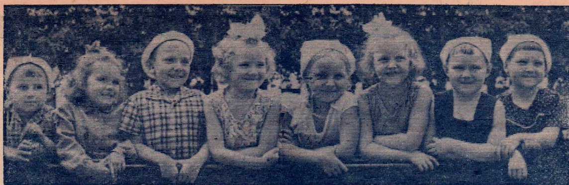
Вот они, самые юные тракторостроители — воспитанники детсада № 3.

За время своего существования институт подготовил 526 инженеров-механиков, а за последний учебный год филиал института выпустил 92 инженера по трем специальностям: «Машины и технология литейного производства», «Технология ма-