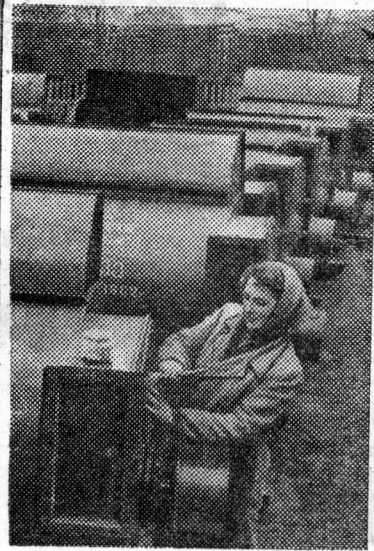
КРЫМСКАЯ ОБЛАСТЬ. Джанкойский машиностроительный завод начал массовый выпуск для сельского хозяйства механизированных измельчителей грубых кормов и прицепных тракторных самосвальных тележек. На снимке: готовые измельчители грубых кормов.

И. ПУСТЫННИКОВ. («Алтайская правда» за 13 июня.)