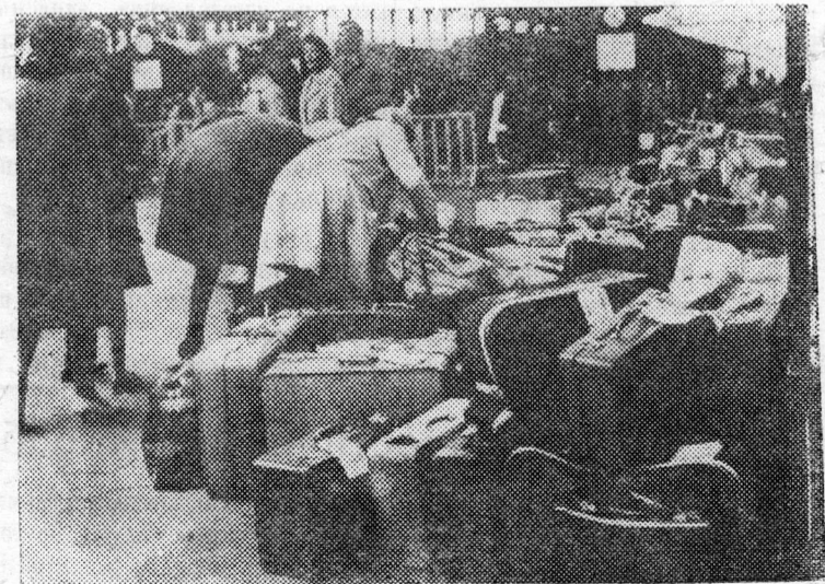
ФРАНЦИЯ, Париж. На вокзале Сен-Лазар во время забастовки железнодорожников.

12 июня выехала на тренировки в Змеиногорский район команда велосипедистов нашего завода. Будут проведены тренировочные гонки по змеиногорскому шоссе. Команда в составе 12 человек сильнейших велосипедистов Алтайского тракторного завода упорно готовится к предстоящим соревнованиям на первенство краевого совета общества «Труд». Борьба за первое место в крае предстоит напряженная. Поэтому гонщики вкладывают в тренировки все силы. Тренировочные сборы будут продолжаться 10 дней. Спортсмены будут играть в волейбол, баскетбол, заниматься легкой атлетикой, вести всестороннюю подготовку к соревнованиям.