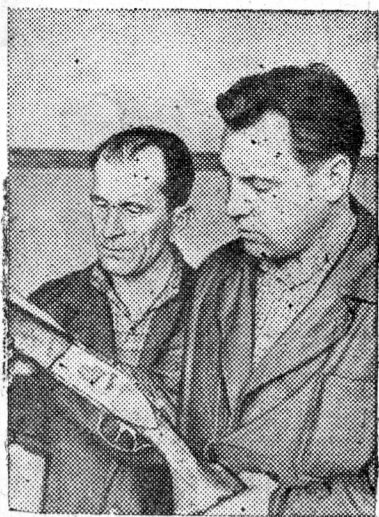
Коллектив Тульского оружейного завода 9 и 10 июня отмечает 250-летие своего предприятия. Основанный Петром Первым в 1712 году, Тульский оружейный завод сыграл в этот период и в последующие времена немаловажную роль в деле защиты русской земли от иностранных захватчиков.