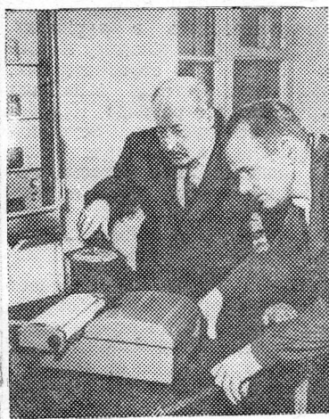
На Московском заводе портативных пишущих машин создана электрическая пишущая машина «ЭУМ-23» для автоматиче-

ской регистрации данных о режиме и ходе производственных процессов. Эти данные передают на машину, посылая соответствующие электрические сигналы, специальные приборы, регулирующие производственные процессы.