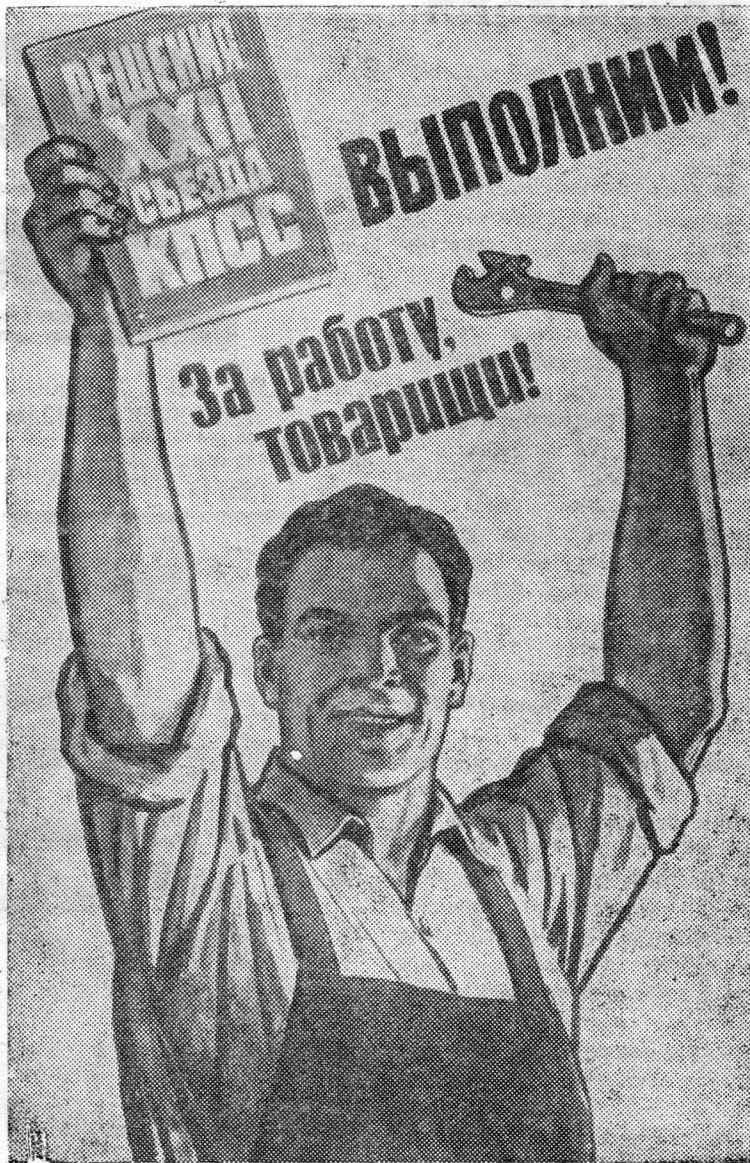
Планет художника В. Иванова (ИЗОГИЗ).