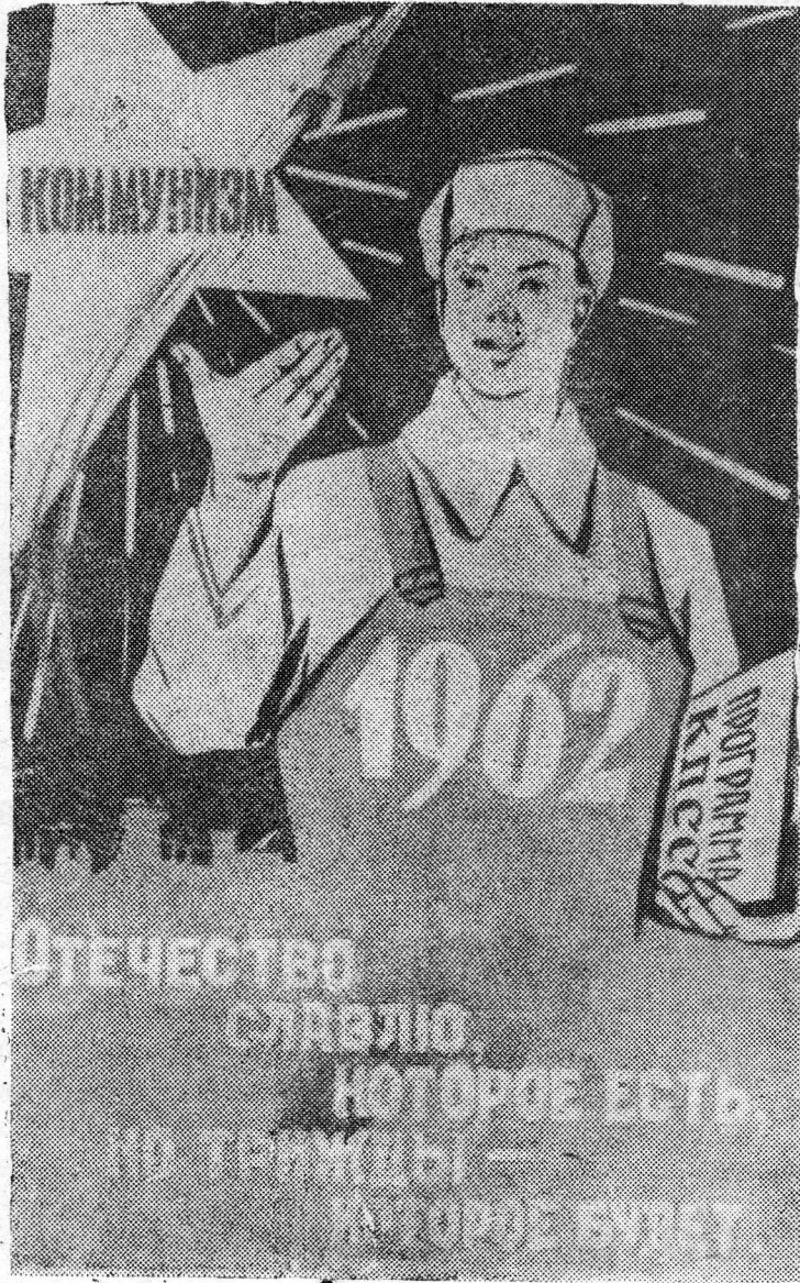
Плакат художника Б. Антонова.