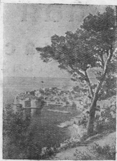
В ФЕДЕРАТИВНОЙ НАРОДНОЙ РЕСПУБЛИКЕ ЮГОСЛАВИИ.