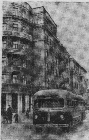
В Саратове недавно пущена новая, третья троллейбусная линия, связывающая центр города с Октябрьским районом.