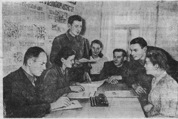
БЕЛОРУССКАЯ ССР. Стрельнянскую избучитальню Ивановского района Брестской области охотно посещают колхозники сельхозартели «Путь к коммунизму». Здесь можно почитать свежую газету или журнал, послушать радиопередачу, лекцию, концерт художественной самодеятельности, посмотреть кинофильм.

II Большой познавательный интерес представляет Марс. Не случайно о нем так много написано фантастических романов, ему посвящено множество исследований (Окончание на 4 стр.)