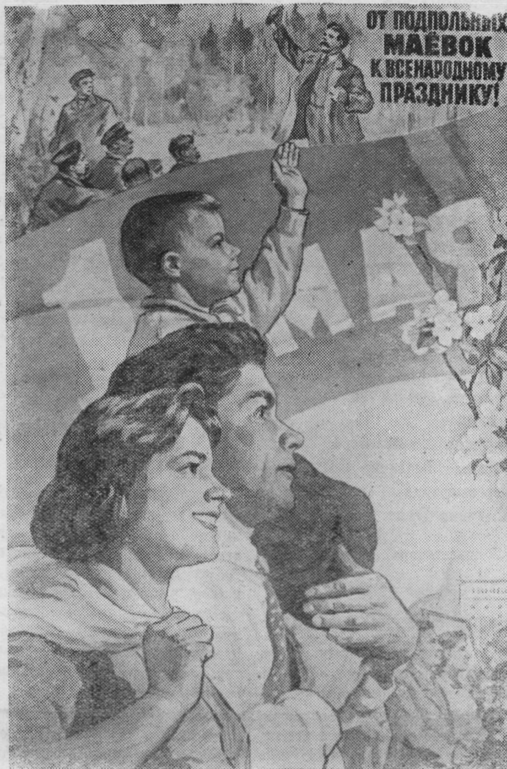
ОТ ПОДПОЛЬНЫХ МАЕВОК К ВСЕНАРОДНОМУ ПРАЗДНИКУ!

Да здравствует 1 Мая—день международной солидарности трудящихся, день братства рабочих всех стран!