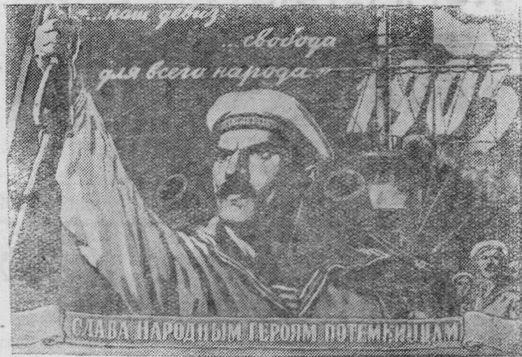
Плакат художника В. Иванова (Государственное издательство изобразительного искусства).

Пленум принял развернутое решение по коренному улучшению работы с кадрами в промышленности, на транспорте и строительстве.