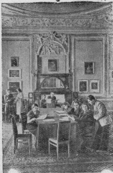
МОСКВА. Клуб комбината «Трехгорная мануфактура».

Славно потрудились молодежь в этот день. Своими руками юноши и девушки собрали 11 тракторов, 20 узлов задних мостов, 14 моторов. Кроме этого полностью собрано 20 моторов и 26 кабин.