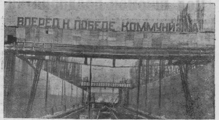
КУЙБЫШЕВГИДРОСТРОЙ. Первый пусковой объект Куйбышевского гидроузла—двухкамерные судоходные шлюзы—вступит в строй весной 1955 года. Сейчас на шлюзах идет монтаж гигантских створок рабочих ворот, установка механизмов управления, укладка бетона и монтаж арматуры на верхних ярусах. На снимке: общий вид сооружения левой камеры нижних судоходных шлюзов.

И. ИШКОВ, нормировщик 2-го строй- участка треста № 46.