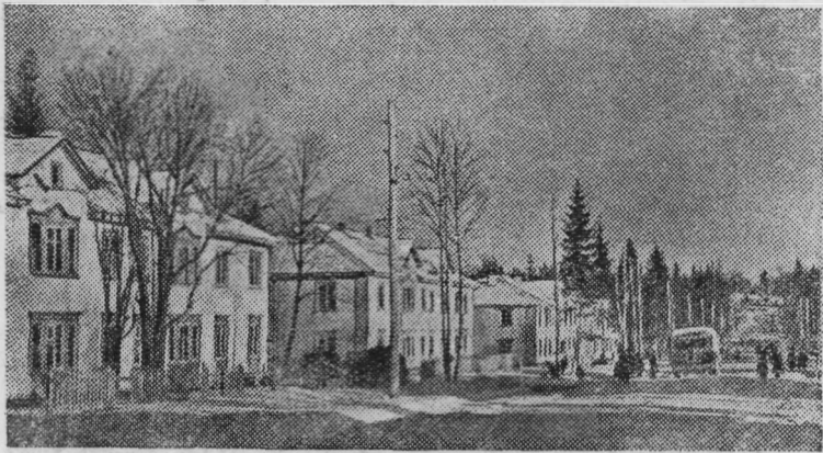
Башкирская АССР. В поселке строителей Уфинской ГЭС построены дома площадью в 35 тысяч квадратных метров. Возведены школы, клуб, больница, детские сады и ясли, пекарни, столовые, магазины, проложен водопровод. На снимке: одна из улиц поселка.