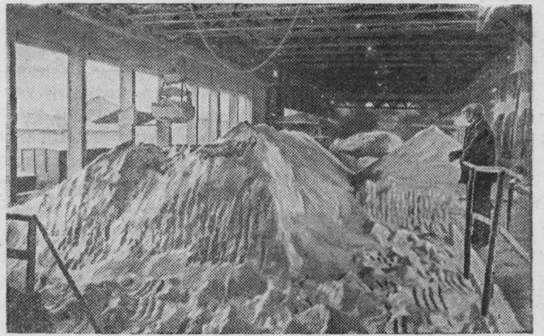
РИГА. Суперфосфатный завод увеличивает выпуск минеральных удобрений для сельского хозяйства. С начала года выработаны сотни тонн минеральных удобрений сверх плана.