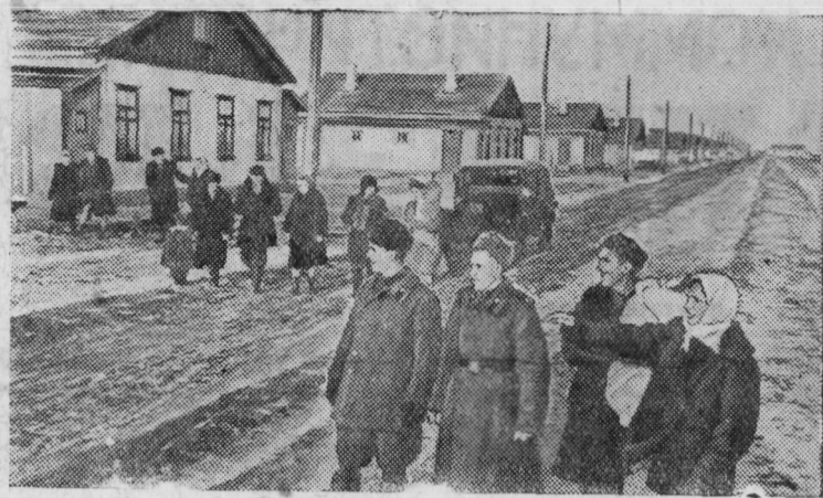
Саратовская область. Весной прошлого года в Озинском районе был создан зерносовхоз «Урожайный». Сейчас в степи вырос новый поселок. Здесь построены десятки жилых домов, баня, пекарня, столовая. Новый совхоз непрерывно пополняется новоселами. Недавно сюда приехала группа демобилизованных воинов Советской Армии.

Собрание партийного актива приняло развернутое решение, направленное на неуклонное претворение в жизнь исторических решений январского Пленума ЦК КПСС.