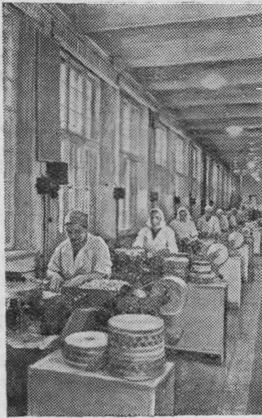
Рига. На кондитерской фабрике «Узвара» сдан в эксплуатацию карамельный цех.

председатель цехнома инструментального цеха АЗТЭ.