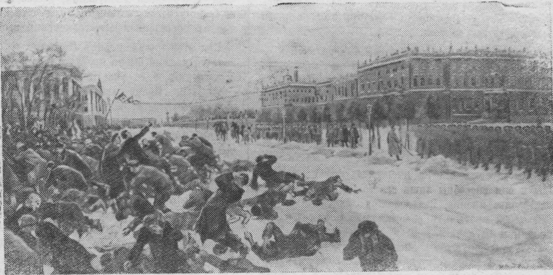
«Расстрел рабочих у Зимнего дворца 9 января 1905 г.» Репродукция с картины художника И. Владимирова.

Готовится также литературно-художественный вечер, посвященный первой русской революции.