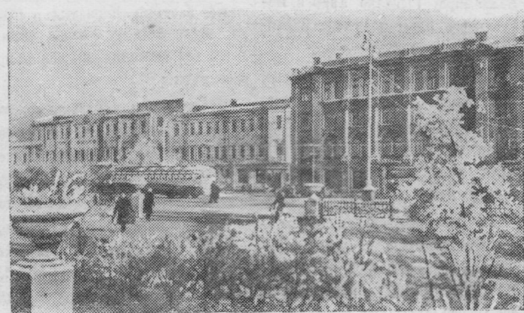
ОМСК. Улица Мопра.