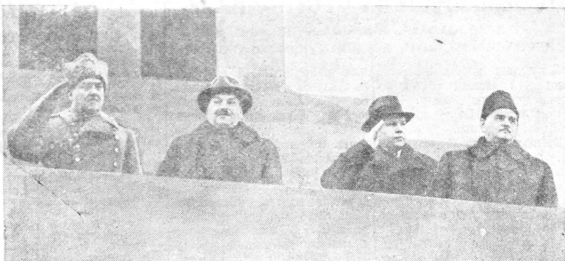
На снимке: Н. А. Булганин, А. А. Жданов, Н. А. Вознесенский, Н. М. Шверник на трибуне мавзолея во время прохождения демонстрации трудящихся по Красной площади.