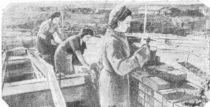
Развернулись работы по восстановлению Пулковской обсерватории под Ленинградом. На снимке: кладка стен одного из зданий обсерватории.