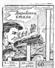
«... Это дело можно сделать...» СТАЛИН Пресскнижка ТАСС

«... Нам нужно добиться того, чтобы выжила ленность могла производить ежегодно... до 60 миллионов тонн стали...»