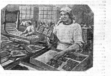
Товарищи колдипра! Давайте-ка ответим Стахановской работой на героические дела. Убод нас за чьем выжили и взрослые и дети, Убод гавило сладостей для каждого и ребенка.