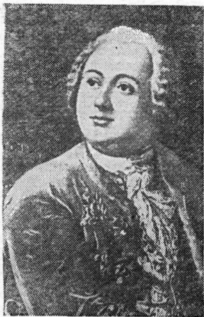
Михаил Васильевич Ломоносов (1711—1765 гг.), великий русский ученый и писатель.

Естествоиспытатель, философ, поэт, историк, педагог, художник, исследователь природных богатств нашей страны, общественный деятель и организатор науки — вот далеко не полный перечень тех областей его деятельности, в которых он проявил свои способности, проложил новые пути.