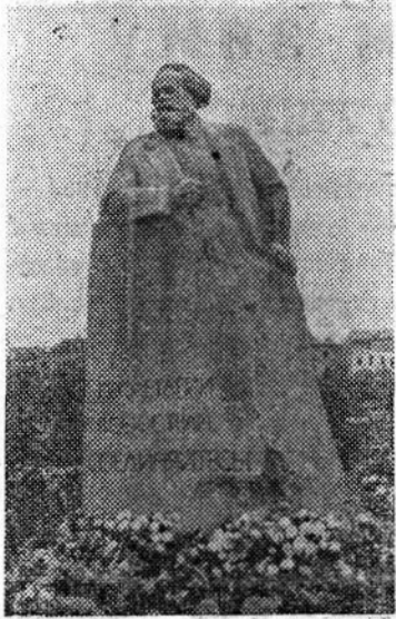
МОСКВА. Памятник Карлу Марксу.