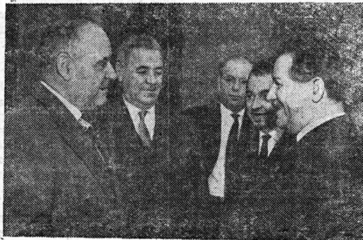
Москва. XXII съезд Коммунистической партии Советского Союза.

На снимке: первый секретарь ЦК Румынской рабочей партии Г. Георгиу-Деж беседует с членом Политбюро ЦК Болгарской коммунистической партии А. Юговым .