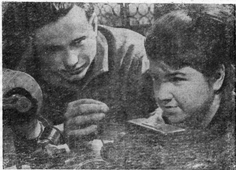
Татарская АССР. Промышленность республики пополнилась новым предприятием. В Бугульме вступил в строй действующих завод нефтеавтоматики.