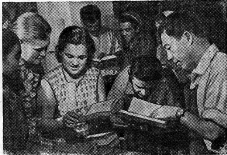
Узбекская ССР. На Бухарской швейной фабрике имени XX-летия ВЛКСМ по инициативе комсомольцев в цехах организованы на общественных началах передвижные библиотечки. Ежедневно во время обеденного перерыва рабочие могут получить интересующие их книги.

Книгоноши — общественники регулярно производят обмен литературы в центральной библиотеке фабрики и хорошо удовлетворяют запросы своих читателей.