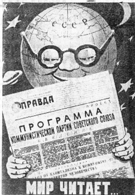
Плакат художника Б. Антонова.

Товарищи тракторостроители! Помните, что Родина ждет от тракторов и запасные части к ним. Усилим трудовое напряжение и в оставшиеся дни ликвидируем отставание. От работы каждого из нас зависит успех выполнения обязательств заводом.