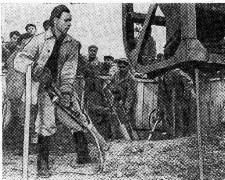
Красноярский край. Строители крупнейшей в мире Красноярской ГЭС ведут укладку первого бетона в тело плотины ГЭС.