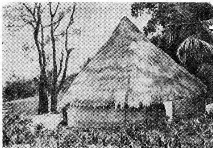
Гвинейская Республика. Типичная хижина местного жителя в селе близ Комакри.