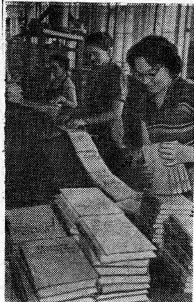
Белорусская ССР. Минский полиграфический комбинат имени Якуба Коласа заканчивает выпуск 30 миллионов экземпляров учебников для школьников к новому учебному году.