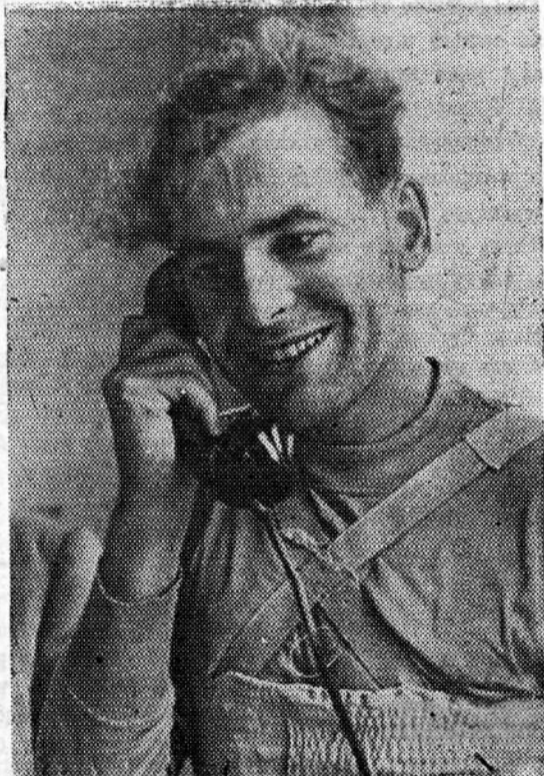
Летчик-космонавт майор Г. С. Титов разговаривает по телефону с Н. С. Хрущевым вскоре после успешного завершения своего космического полета.

— Красиво, наверное, выглядят, но разглядеть не успел, — последовал ответ.