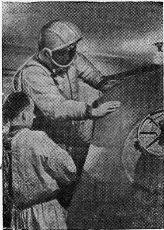
Летчик-космонавт майор Герман Степанович Титов на тренировке перед полетом в космос.

Я побывал в колхозе, на землю которого с облачных высот спустился космический корабль «Восток-2». Поговорил с людьми, встретившими его первыми. Неизгладимое впечатление осталось у простых советских тружеников от бесед с русским богатырем Германом Титовым. В какой бы дом я ни зашел, везде слышал восторженный разговор о выдающихся победах нашей науки и техники, о славном подвиге коммуниста Титова.