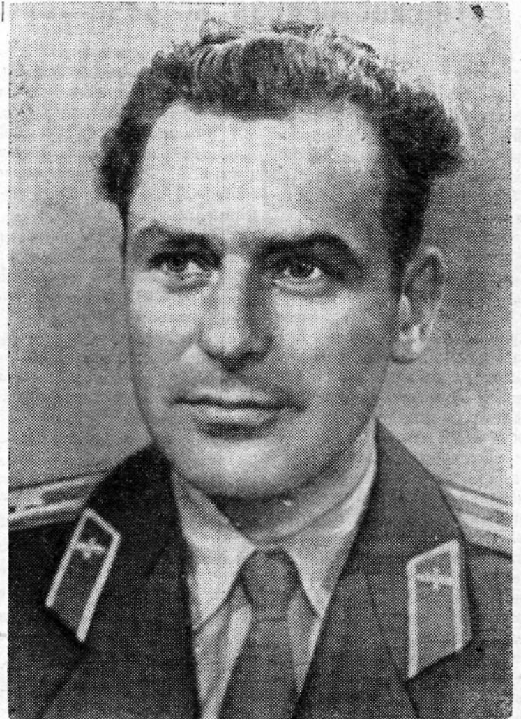
6 августа 1961 года в 9 часов московского времени в Советском Союзе произведен новый запуск на орбиту спутника Земли космического корабля «Восток-2». Корабль «Восток-2» пилотировался гражданином Советского Союза летчиком-космонавтом майором товарищем Титовым Германом Степановичем.

На снимке: летчик-космонавт майор Герман Степанович Титов.