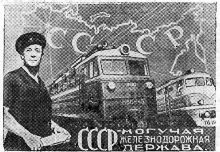
Фотомонтаж Б. Антонова.