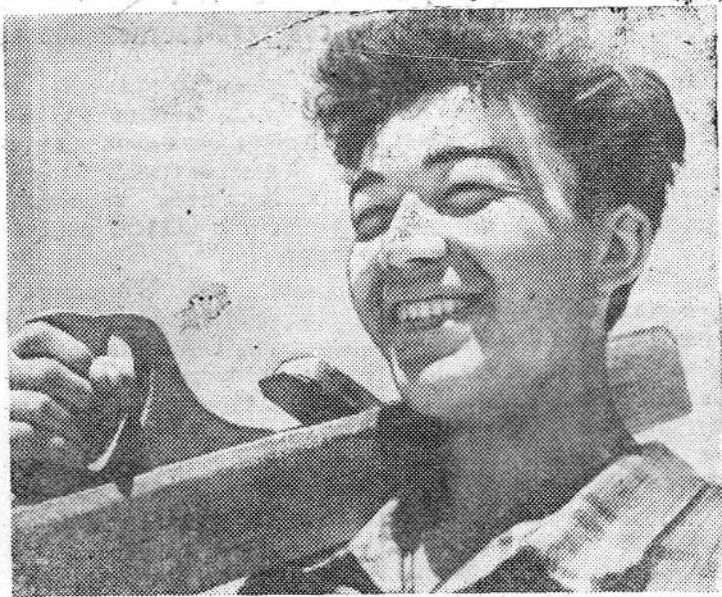
Узбекская ССР. Строящаяся Ташкентская ГРЭС будет работать на природном газе Бухарского месторождения. Это ударная комсомольская стройка.

На Карелии, прибалтийских советских республик, Целинного края и других мест на завод поступили заказы на тракторы с полугусеничным ходом. Коллектив тракторозаводцев обязался изготовить в июне 1.000 комплектов полугусеничного хода к серийным колесным тракторам и отправить их потребителям.