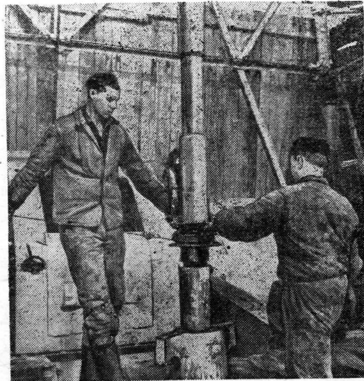
Чехословацкая Социалистическая Республика. Недавно на Южно-Моравском нефтяном промысле началось бурение новой скважины глубиной 4 тысячи метров.

Для освоения этой скважины Советский Союз поставил буровую установку «Уралмаш ЗД» высотой 53 метра. Вместе с чехословацкими нефтяниками здесь работают советские специалисты.