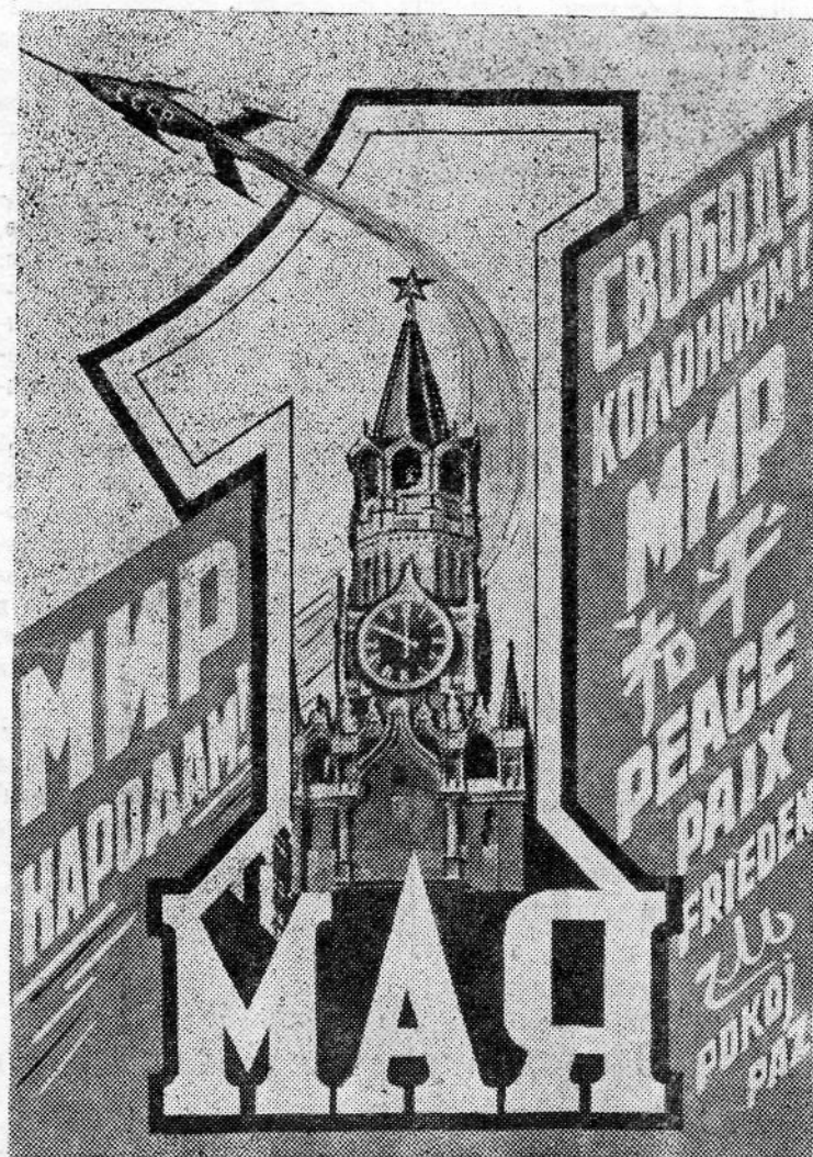
Фотоплакат Б. АНТОНОВА.

На два дня раньше срока закончила программу апреля смена тов. Бондаренко. М. НОВИКОВ.