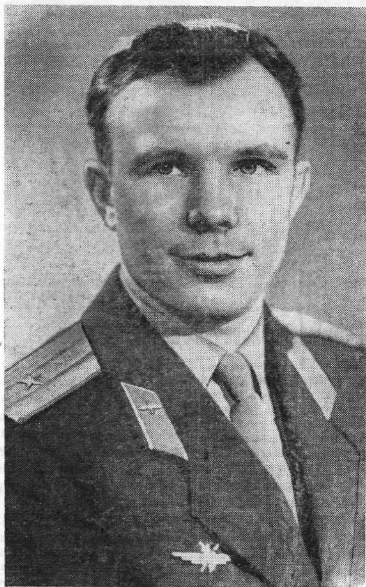
ГАГАРИН ЮРИЙ АЛЕКСЕЕВИЧ — первый в мире пилот-космонавт, совершивший 12 апреля 1961 года полет в корабле-спутнике «Восток».

Свои трудовые успехи чугунолитейщики посвящают первому полету человека в космос.