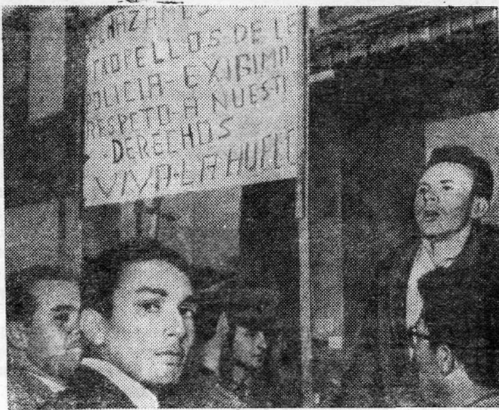
В Колумбии больше месяца продолжается забастовка на предприятии «Леонидас Лара и Ко» — одной из крупнейших фирм в стране. Администрация угрожает закрыть предприятие, если рабочие не вернутся на работу.