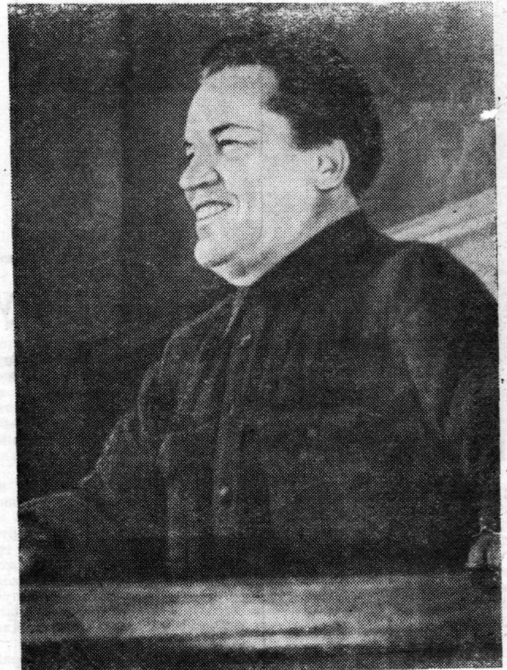
Сергей Миронович Киров — выдающийся деятель Коммунистической партии и Советского государства, верный ученик В. И. Ленина, глаженный трибун революции.