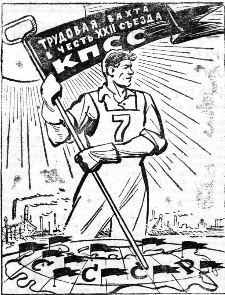
Рис. В. Жаринова. На вахте мира!