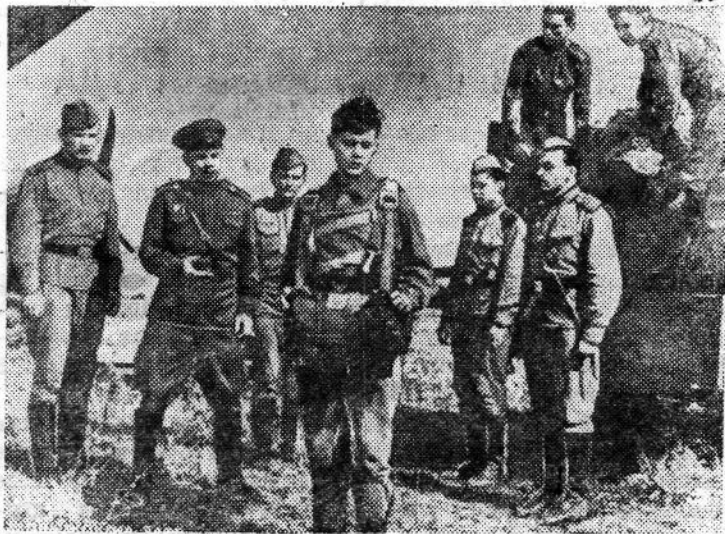
Кадр из новой кинокартины «Прыжок на заре» производства киностудии имени М. Горького. Фильм поставлен режиссером И. Лукинским по сценарию Г. Березко. Фотохроника ТАСС.