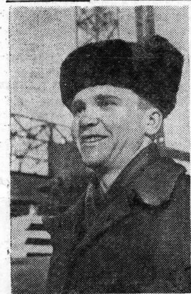
На Челябинском металлургическом заводе сооружается широкополосный стан «2300». Строители обязались досрочно завершить работы.