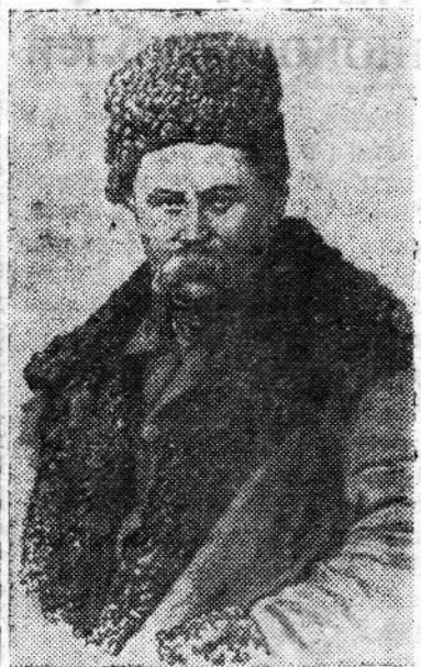
Тарас Григорьевич ШЕВЧЕНКО — великий украинский народный поэт, художник, революционный демократ.