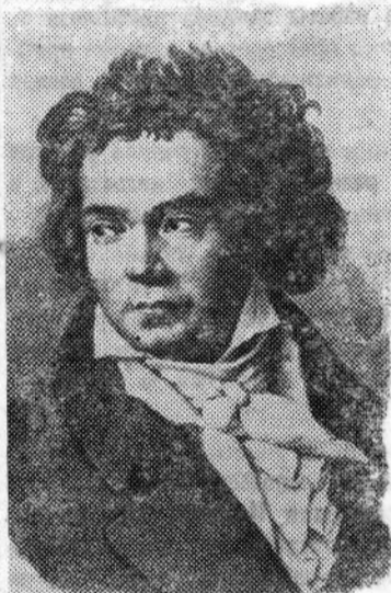
Великий немецкий композитор Людвиг ван Бетховен.