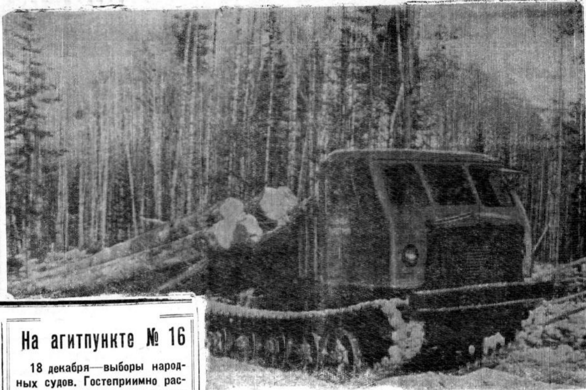
НА СНИМКЕ: новый трактор ТДТ-75 на испытаниях.