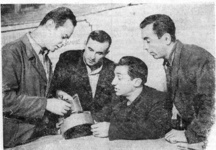
На Харьковском заводе торгового машиностроения около года существует молодежное самодеятельное опытно-конструкторское бюро. В его состав вошли инженерно-технические работники — члены научно-технического общества машиностроительной промышленности.

Конструкторское бюро провело ряд мероприятий, направленных на снижение брака и себестоимости изделий. Раньше, например, корпус холодильного компрессора отливался из дорогостоящего титанистого чугуна. Члены бюро предложили заменить его серым чугуном. Это мероприятие дало возможность ликвидировать брак при литье и значительно снизить себестоимость изделия. Механизация транспортировки стержней к рабочему месту снизила себестоимость изготовления их на 30 процентов.