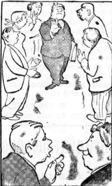
— Кого это агитируют? — Агитатора пойти в цех к рабочим.