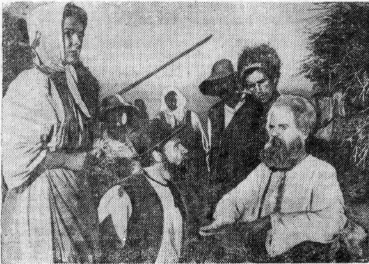
Кадр из нового художественного фильма «Таврия». Производство киностудии имени А. П. Довженко.

Коллектив завода хорошо понимает, что отправка тракторов на экспорт является достойным вкладом тракторостроителей в развитие дружественных отношений с зарубежными странами, в благородное дело мира.