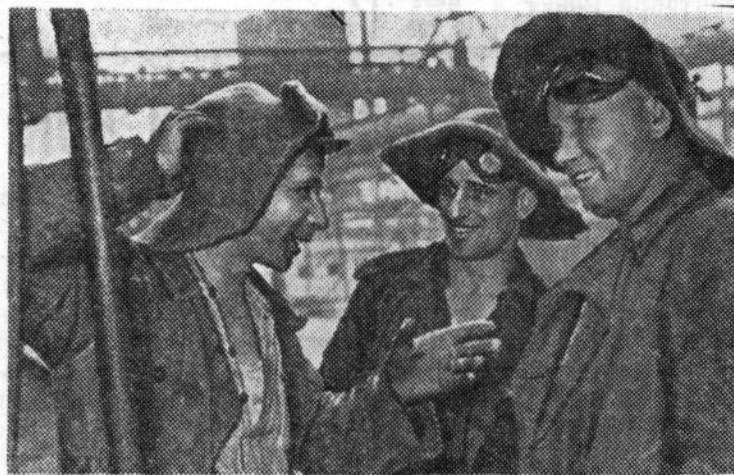
Сталинская область. Коксовому цеху Ждановского коксохимического завода присвоено звание цеха коммунистического труда. Коллектив выдал с начала года несколько тысяч тонн кокса сверх задания.