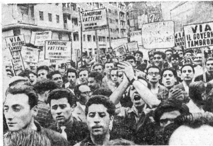
Италия. В Милане состоялась демонстрация протеста против кровавой расправы полиции с участниками антифашистской демонстрации в Реджо-Эмилия.

На снимке: во время демонстрации. Плакаты гласят: «Долой правительство Тамброни», «Уходи, Тамброни! Мы хотим антифашистское правительство!»