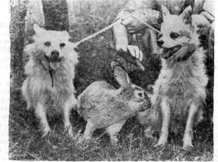
Москва. В Советском Союзе в соответствии с программой исследования космического пространства был произведен очередной запуск одноступенчатой баллистической ракеты с тремя животными на борту. Полет совершили собаки Отважная, Малек и крольчиха Звездочка. Общий вес ракеты составлял 2.100 килограммов.

Преступные замыслы правящих кругов США против Кубы ни для кого не являются теперь секретом. Американская газета «Уолл-стрит джурнал» недавно писала, что официальные лица в Вашингтоне рассматривают вопрос о том, «каким образом ускорить падение кубинского правительства Кастро». Ради достижения этой цели американские империалисты идут на все — они организуют экономическую блокаду Кубы и готовят военную интервенцию против нее. В этих условиях наша страна протянула руку помощи кубинскому народу. Глава Советского пра-