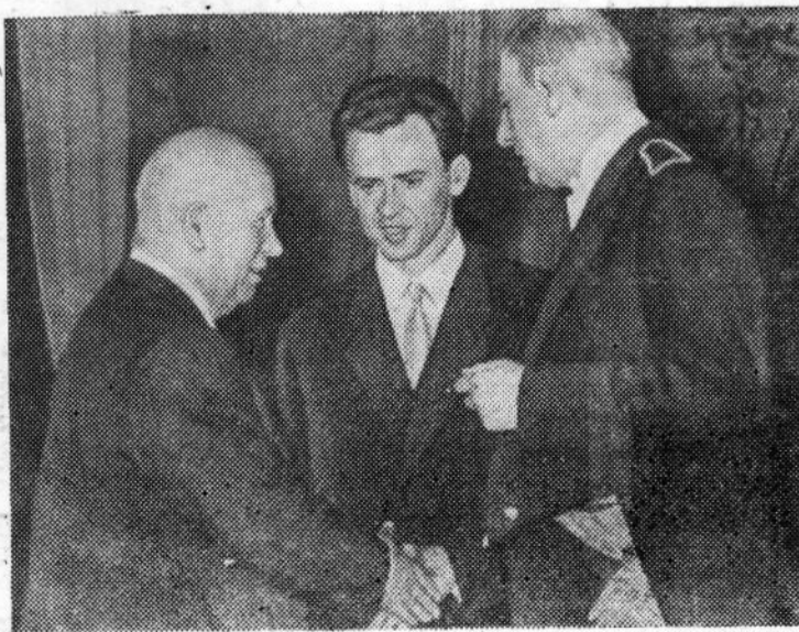
На снимке: в Елисейском дворце. Н. С. Хрущев и президент Ш. де Голль обмениваются рукопожатием.

Больше часа длился этот дружеский визит. Вся деревня сердечно провожала дорогих гостей.