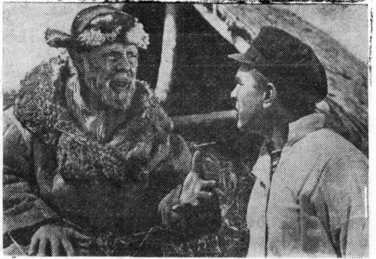
Кадр из кинофильма «Поднятая целина». Производство киностудии «Ленфильм».

мола завода проведено 4 воскресника на стадионе, где были вырыты ямы под трибуну. Сейчас строители ведут сварочные работы и устанавливают цельнометаллический каркас, после чего молодежь будет обшивать его досками. Комсомольцы-модельщики приступили к изготовлению штакетника, а комсомольцы ЖКО готовятся к вспахиванию и посеву травы на футбольном поле. Намечены воскресники по строительству южной трибуны и спортивных площадок. Первая очередь строительства стадиона будет закончена в первых числах июля этого года.